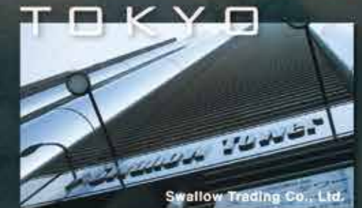
Swallow Trading Co., Ltd.

本社 / 長野県飯山市 2015年の新幹線飯山駅開業で東京から最速1.5時間で到着します。飯山駅は斑尾高原、野沢温泉、木島平、戸狩温泉等スキー場の玄関口です。