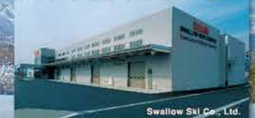
Swallow Ski Co., Ltd.

本社 / 長野県飯山市 2015年の新幹線飯山駅開業で東京から最速1.5時間で到着します。飯山駅は斑尾高原、野沢温泉、木島平、戸狩温泉等スキー場の玄関口です。